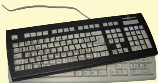
Решетка за тастатура